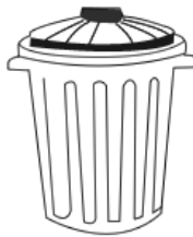
Déchets non recyclables